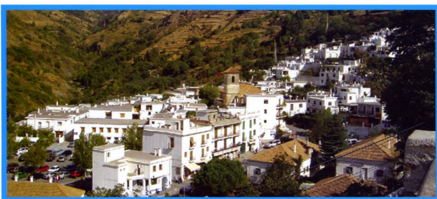
Vista de Pampaneira